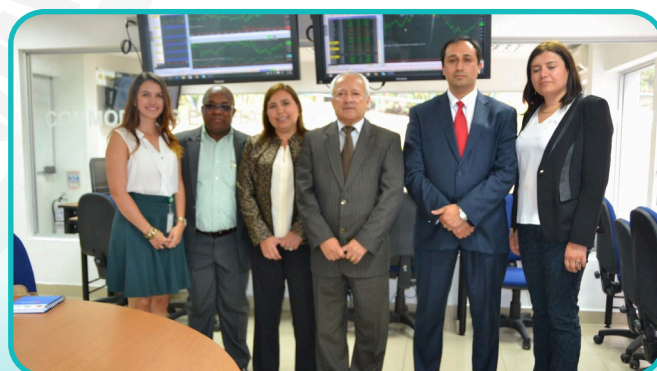
Directivas del Centro de Formación Técnica San Agustín de Talca de Chile y Directivos del Tecnológico de Antioquia