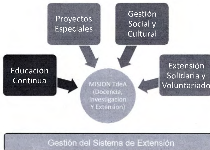
Gráfico 1: Modalidades de Extensión académica TdeA.

ARTÍCULO 18: EDUCACIÓN CONTINUA: La Educación Continua es una estrategia de formación en educación no formal que, de manera organizada, promueve la realización de procesos académicos a nivel teórico y práctico que conlleven al fortalecimiento de actitudes, hábitos y aptitudes y el mejoramiento del desempeño en un área específica de conocimiento. Su propósito es la actualización, profundización, perfeccionamiento y/o desarrollo de habilidades y competencias que contribuyen al crecimiento del individuo y su proyección en el entorno en el que se desenvuelve. Se dirige a personas de la comunidad