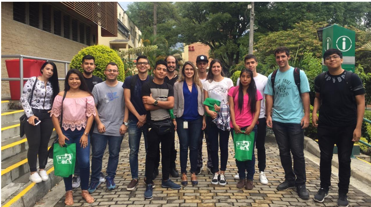
Estudiantes extranjeros que realizan semestre de intercambio en el TdeA con los estudiantes colombianos miembros del programa Partners TdeA

Las Instituciones de Educación Superior del Nodo Occidente de la RCI, se han encargado de dinamizar los procesos académicos departamentales y nacionales a nivel mundial y han visibilizado las competencias académicas de las instituciones paisas en el contexto internacional.