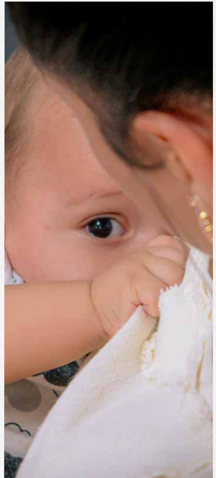
La Sala de Lactancia del TdeA brinda un momento de intimidad entre la madre y el bebé.

▶▶▶▶▶▶▶▶▶▶ ▶▶▶▶▶▶▶▶▶▶ “Lactar es un acto totalmente natural. El TdeA dispuso de un cómodo espacio para que, además de dar leche materna a sus bebés, las mamás puedan almacenarla a una temperatura adecuada”. ▶▶▶▶▶▶▶▶▶▶ ▶▶▶▶▶▶▶▶▶▶