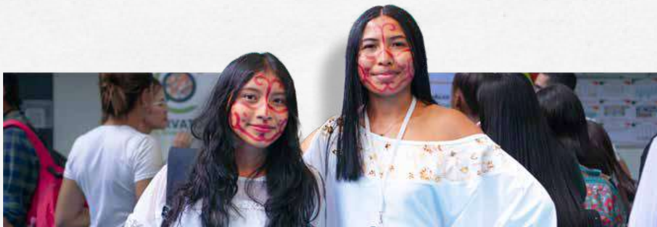
Los participantes de la Feria Date Cuenta recibieron información en cada una de las estaciones ubicadas en el coliseo.

El coliseo del TdeA se convirtió en un espacio de creatividad y juegos durante la Feria Date Cuenta que, de una forma didáctica e interactiva, mostró el avance de las cinco líneas estratégicas del Plan de Desarrollo de la Institución, en el marco de la Rendición de Cuentas versión 2023.