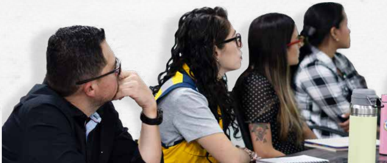
El Plan de Ayuda Mutua sesionó por primera vez este año en la sede del TdeA.

Un plan de atención de emergencias exige tener aliados que amplifiquen la capacidad de respuesta ante los diferentes frentes que supone una eventualidad como atención de heridos, evacuación, préstamo de herramientas como camillas, extintores; solución temporal o definitiva de la emergencia, entre otras tareas.