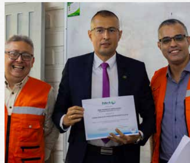
Los miembros de la Brigada de Emergencia del TdeA están comprometidos con la capacitación permanente.

La Brigada de Emergencia recibió capacitación con el cuerpo de bomberos de Envigado para certificarse en atención prehospitalaria y de emergencia, con el apoyo del TdeA Institución Universitaria.