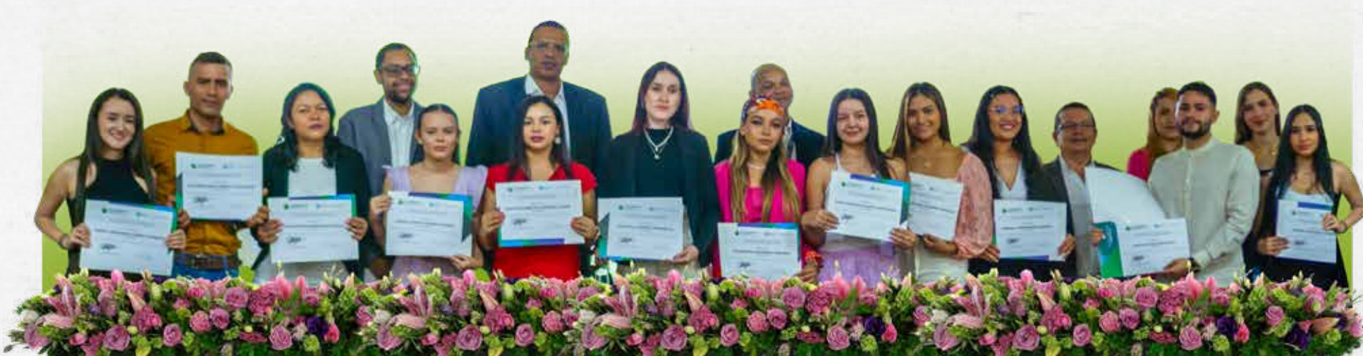
La microtitulación del curso TdeA-DIAN es una fortaleza adicional de los estudiantes de Contaduría Pública.

El TdeA Institución Universitaria realizó la certificación de la primera cohorte del Núcleo de Apoyo Contable y Fiscal – NAF, un logro significativo alcanzado gracias a la alianza estratégica con la Dirección de Impuestos y Aduanas Nacionales – DIAN seccional Medellín.