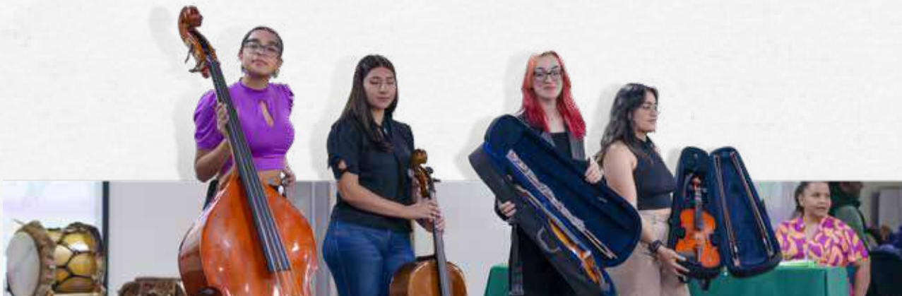
La entrega de instrumentos musicales incentiva su práctica.

Con el propósito de potenciar el deporte y el arte entre los integrantes de la comunidad académica, en el TdeA Institución Universitaria se entregó nueva implementación para la actividad física y la cultural.